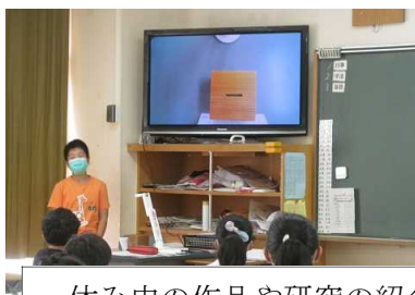
休み中の作品や研究の紹介