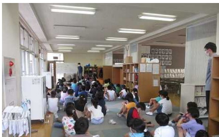
学年集会「どんな2学期にする？」

集うことそのものが「学び」になるのだー 1学期に述べたとおりです。この集いが途切れないよう、細心の注意を払いながらの生活です。昨日配布の『保健だより』『健康観察・欠席報告のオンライン化(お知らせ)』にあるように、各ご家庭でのご協力を何卒お願いいたします。