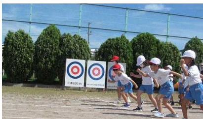
1年生 運動会に向けて「走るぞ！」