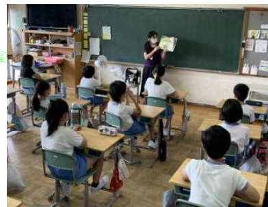
今年度は各自の席で聴きました

「でんでんむしの会」の皆様による読み聞かせ。今年度は新型コロナウイルス感染防止のため、通年での開催はできないでしまいましたが、火曜日の朝、様々なジャンルの本を紹介いただき子どもたちの読書の世界を広げることができました。ありがとうございました。新年度の再開を子どもたちは心待ちにしています。